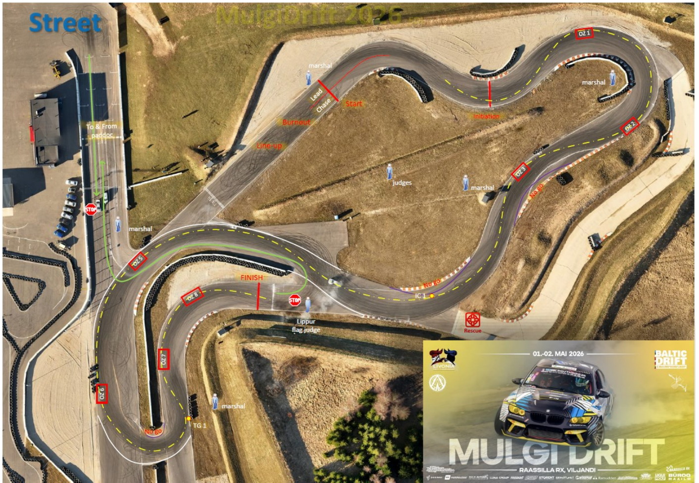
Pro2 / PRO võistlusrada